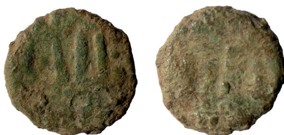
Lámina nº 24

Sector 1, Corte 2 A, UE 53 Peso 3,50 g / Diámetro 12 mm / 4 mm espesor Gobernadores dependientes de Damasco (s VIII) Anverso: No dios si / no Dios Reverso: Mahoma (es) el / enviado de Dios Frochoso II-c