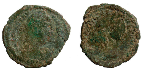
Lámina nº 11