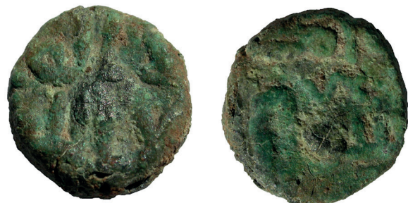
Lámina nº 20