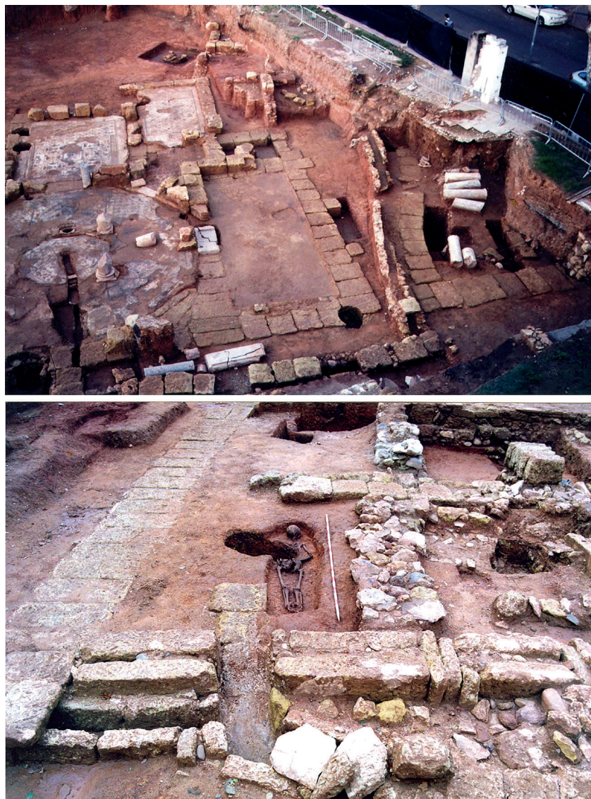
Fig. 2: Vista general de las dos intervenciones (PENCO, 2005; SALINAS, 2004).

ron una acentuada perduración en el tiempo, algo habitual en los grandes y medianos bronce que fueron profusamente acuñados en esta época. En Clunia por ejemplo se halló un ejemplar de Claudio I semejante al nuestro incluido en un conjunto que se fecha en el último cuarto del siglo III (GURT, 1970: 70). En otros casos, su período de vida llega incluso hasta el siglo IV (BALIL, 1958: 27) 2 .