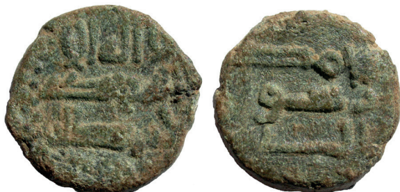
Lámina nº 22

Sector 1, Corte 5 A, UE 37 Peso 1,60 g / Diámetro 12 mm Gobernadores dependientes de Damasco (S. VIII) Anverso: No dios si / no Dios Reverso: Mahoma (es) el / enviado de Dios. Frochoso II-a