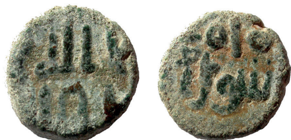
Lámina nº 23

Sector 2, Corte 1-2, UE 22 3,75 g / Diámetro 14 mm Anverso: No dios sino / Dios sólo El / no compañero para El Reverso: Dios es uno / Dios es eterno / Y no fue engendrado Orlas ilegibles Frochoso XX-b