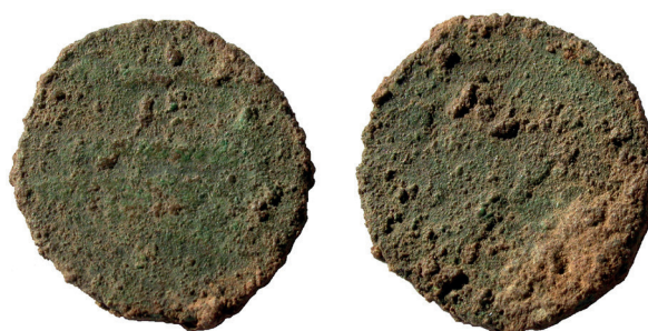
Lámina nº 30