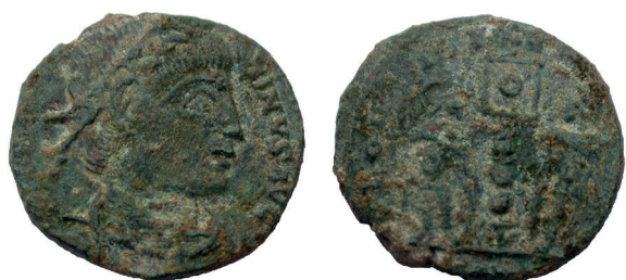
Lámina nº 9