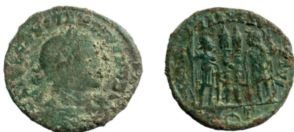
Lámina nº 6