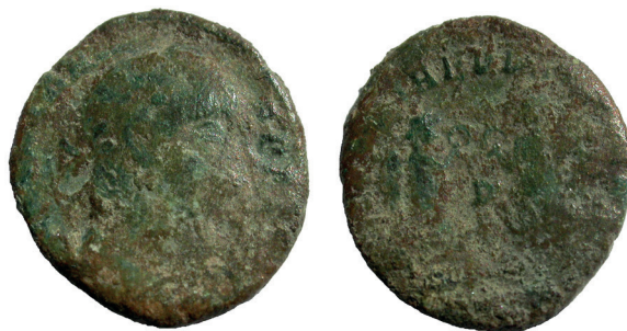
Lámina nº 7