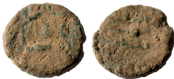
Lámina nº 27