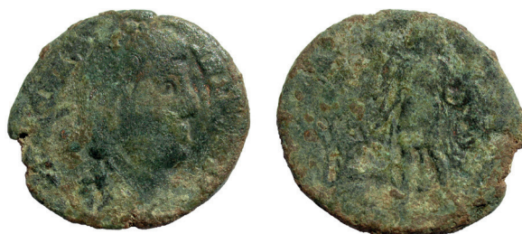
Lámina nº 16