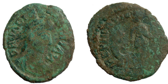
Lámina nº 15