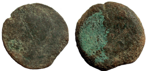
Lámina nº 2

Reverso: LIBERTAS (AVGUSTA) Alegoría de la “Libertad” estante, sosteniendo un gorro frigio ( pileus ) con su mano derecha y extendiendo la izquierda. SC en letras grandes a ambos lados.