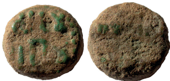
Lámina nº 21

Sector 1, Corte 2 A, UE 53 Peso 3,50 g / Diámetro 12 mm / 4 mm espesor Gobernadores dependientes de Damasco (s VIII) Anverso: No dios si / no Dios Reverso: Mahoma (es) el / enviado de Dios Frochoso II-c