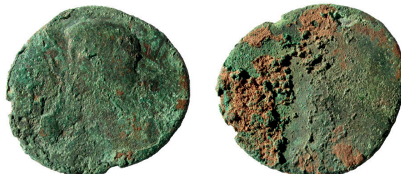
Lámina nº 3

Reverso: Corona de roble rodeando la leyenda [COLO- NIA PATRICIA]