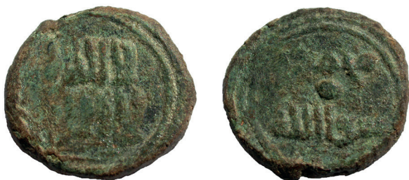
Lámina nº 18