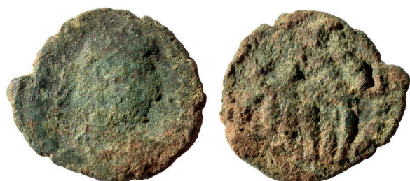
Lámina nº 14