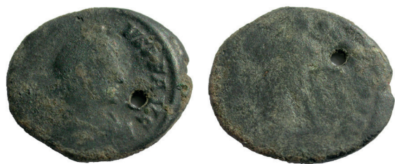
Lámina nº 17