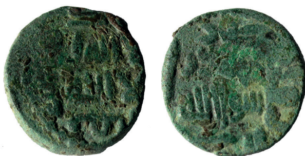
Lámina nº 19