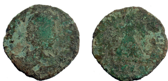
Lámina nº 12