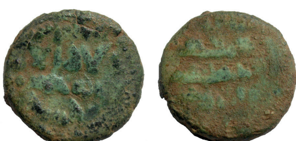
Lámina nº 25

Sector 1, Corte 5A, UE 2 Peso 3,55 g / 14 mm Cronología indeterminada (posible transición del siglo VIII al IX) Anverso: No dios sino / Dios sólo El / no compañero para El Reverso: Mahoma (es) / el enviado de / Dios Frochoso XIII-a