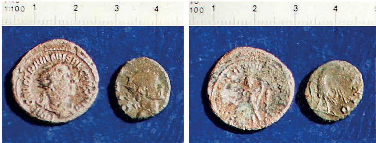
Láms. 31 y 32: Antoninianos de Trajano Decio y Claudio II (póstumo) del sector meridional de la villa (PENCO, 2005).