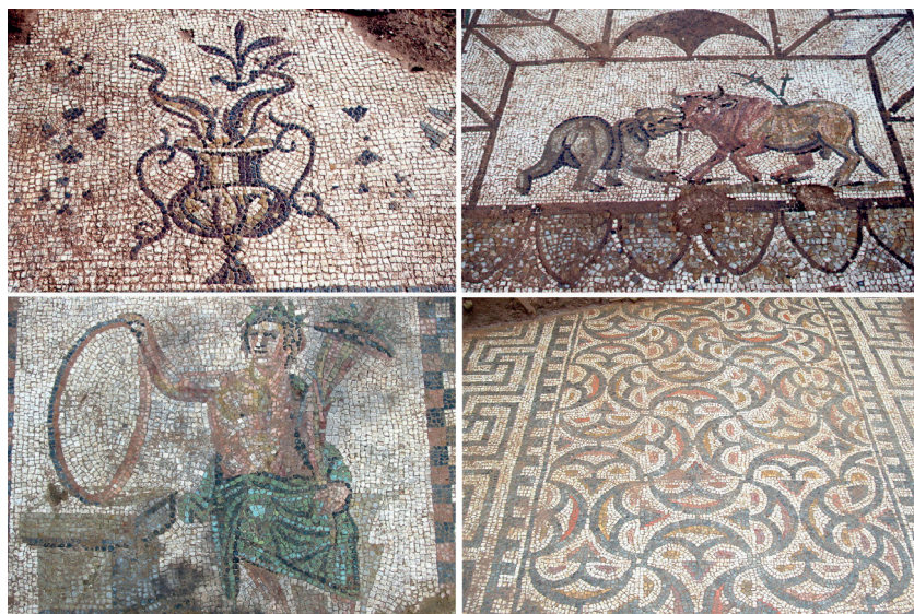
Fig. 3: Decoración con diversos motivos de la villa de Santa Rosa (PENCO, 2005; SALINAS, 2004).

Dos de los tres antoninianos tratados en este capítulo están asociados, junto a otras monedas, a la parte meridional de la villa en estratos bien contextualizados, con localizaciones en peristylum , triclinium y cama o lecho de mosaico (PENCO et alii , 2005). Estas piezas, junto a otros materiales arquitectónicos y cerámicos asociados a ellas, ayudaron a datar con mayor seguridad la cronología inicial de la villa, que se situó entre los años 230 y 320 d.C. (PENCO, 2005: 30).