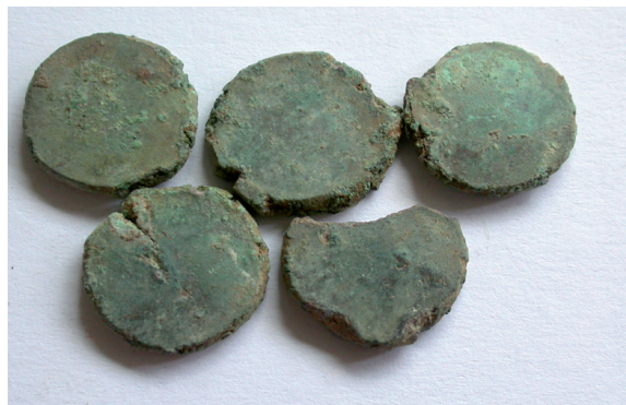
Fig. 4: Cospes y otros metales monetiformes hallados en el sector septentrional de la villa de Santa Rosa (Manzana Banesto).

Estadísticamente, el número de monedas está repartida proporcionalmente entre la dinastía constantiniana y la valentiniana, siendo una pieza de Arcadio el ejemplar romano más moderno documentado. Dicha proporción, en cuanto a emperadores representados, es muy similar a la de los hallazgos del criptopórtico de Cercadilla (MONTEJO, 1996; FROCHOSO, 2008). Destacan dentro de las primeras, y como viene siendo normal, las piezas de Constancio II conocidas como del “jinete caído” ( Fel. Temp. Reparatio ), tipo de extraordinaria difusión, que supone el mayor aprovisionamiento no sólo del subperíodo 348-364 sino de todo el siglo IV. Anteriores a éste, otra tipología aquí ampliamente representada son los que acuñan los sucesores de Constantino I con los reversos Gloria Exercitus y Victoriae DD Augg. Q. NN. durante el período 330-348, etapa que se caracteriza por estar marcada por una fuerte inflación monetaria.