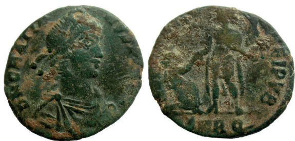
Lámina nº 5