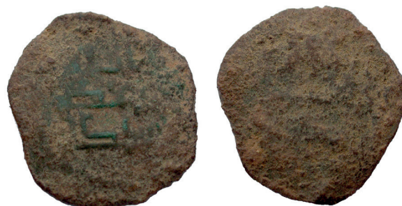
Lámina nº 29