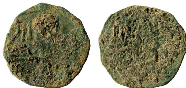
Lámina nº 28