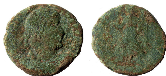
Lámina nº 10