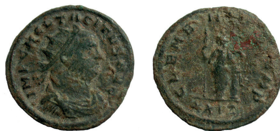
Lámina nº 4