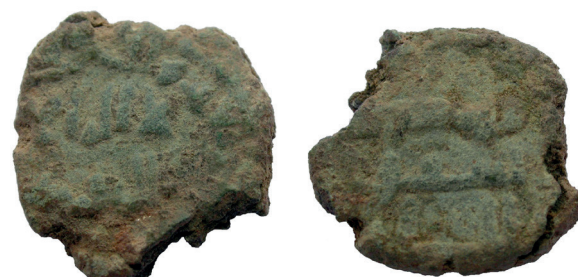
Lámina nº 26

Sector 1, Corte 3, UE 38 Peso 2,35 g / Diámetro 11 mm / 2,5 mm espesor Gobernadores dependientes de Damasco (S VIII) Anverso: No dios si / no Dios Reverso: Mahoma (es) el / enviado de Dios. Frochoso II-a