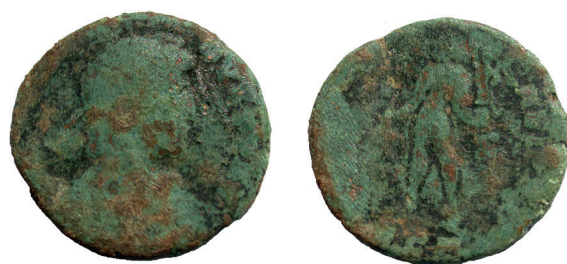
Lámina nº 8

Ceca: R T Roma (tertia). Roma Oficina 3ª