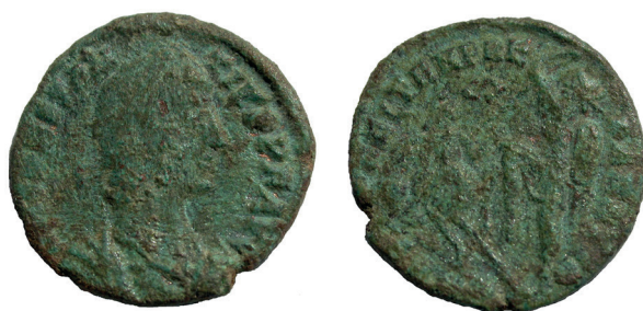
Lámina nº 13