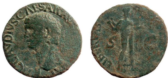
Lámina nº 1